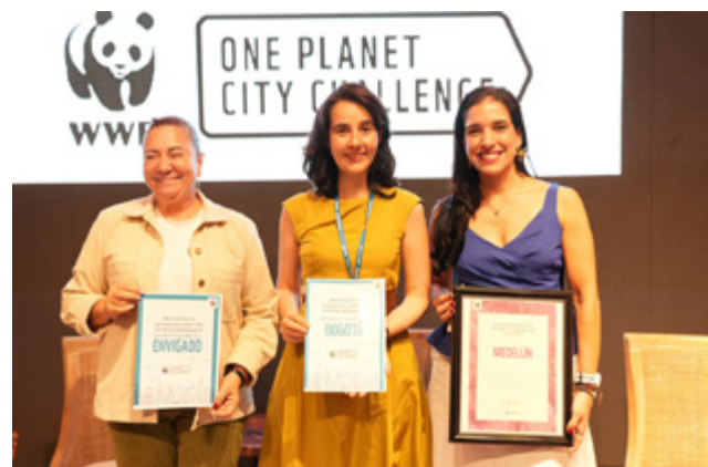
Secretaría de Ambiente. Bogotá fue reconocida como ciudad All-Star

Bogotá fue reconocida como ciudad All-Star, al ser la primera